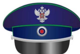
Фуражка к форме одежды для торжественных случаев и повседневной форме одежды для государственных гражданских служащих, имеющих классные чины главной, ведущей, старшей и младшей групп должностей