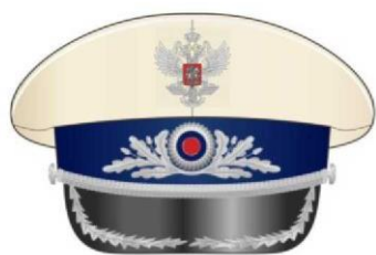
Фуражка к парадной форме одежды для государственных гражданских служащих, имеющих классные чины высшей группы должностей