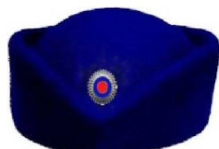
Шляпка из фетра