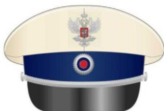
Фуражка к парадной форме одежды для государственных гражданских служащих, имеющих классные чины главной, ведущей, старшей и младшей групп должностей