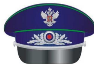
Фуражка к форме одежды для торжественных случаев и повседневной форме одежды для государственных гражданских служащих, имеющих классные чины высшей группы должностей