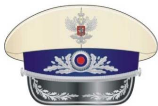
Фуражка к парадной форме одежды руководителя Федерального агентства железнодорожного транспорта