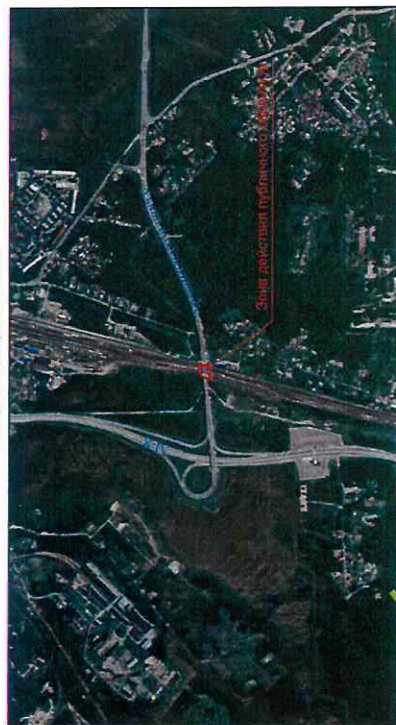
Оберточная схема расположения