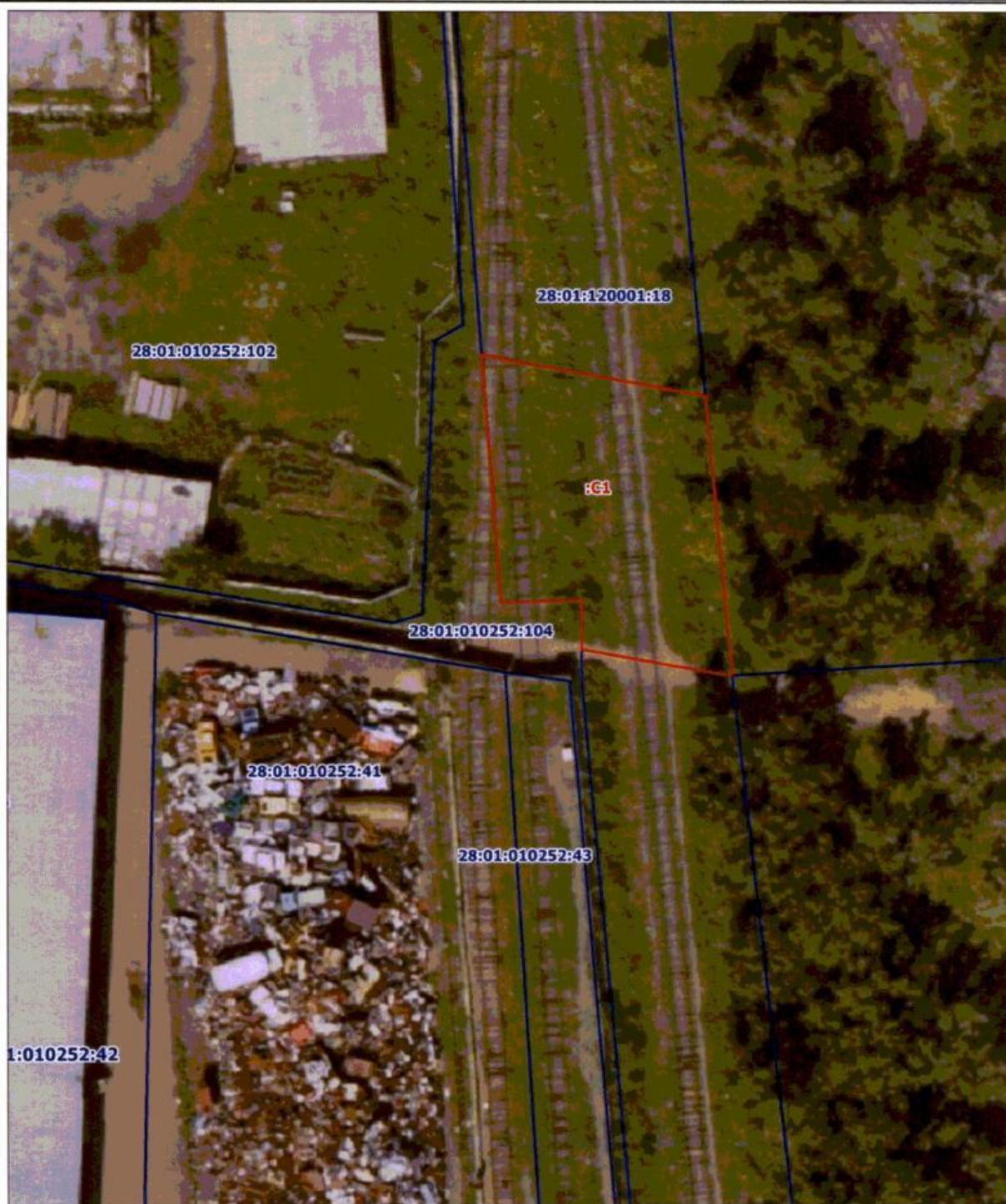
Схема расположения границ публичного сервитута г. Благовещенск, Амурская область